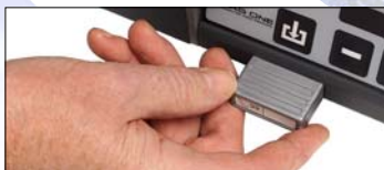
2 Ställ in slipdata

Maskinen är mycket enkel att sköta. Vem som helst kan använda den. Skridskorna får en utomordentlig finish som ger en låg friktion mot isen.