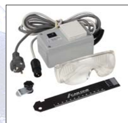
Styrenhet för dammsugare, spetssskydd, skyddsglasögon och transportlinjal,

SPEED ONE och LONG ONE slipar befintlig profil snabbt, 15-20 skridskopar per timme.